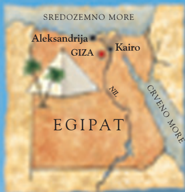
Ova slika prikazuje Kefrenovu piramidu u vreme izgradnje. Kefren (Kafre) bio je Keopsov sin.

VELIKA PIRAMIDA U GIZI U EGIPTU jedino je od Sedam čuda starog sveta koje i danas postoji. Tokom gotovo četiri hiljade godina bila je to najviša građevina na svetu. Kad je završena, dosegala je 147 metara. To je ujedno i najveće i najpreciznije sagrađeno kameno zdanje. Nalazi se na zapadnoj obali reke Nila, a podignuta je za kralja Kufua, drugog vladara iz Četvrte dinastije, kod nas poznatog pod grčkim imenom Keops. Keops je vladao od oko 2551. do 2528. pre n. e. i nadgledao je izgradnju piramide koja je trebalo da mu bude grobnica. Iako se temeljila na piramidi njegovog oca u Dahšuru, mnogo je veća i najavila je veliko doba izgradnje piramida. Piramide su podizane i pre Velike piramide, a još ih je sagrađeno i nakon nje, ali nijedna druga građevina nije toliko oduševljavala svet u razdoblju od preko četiri hiljade godina.